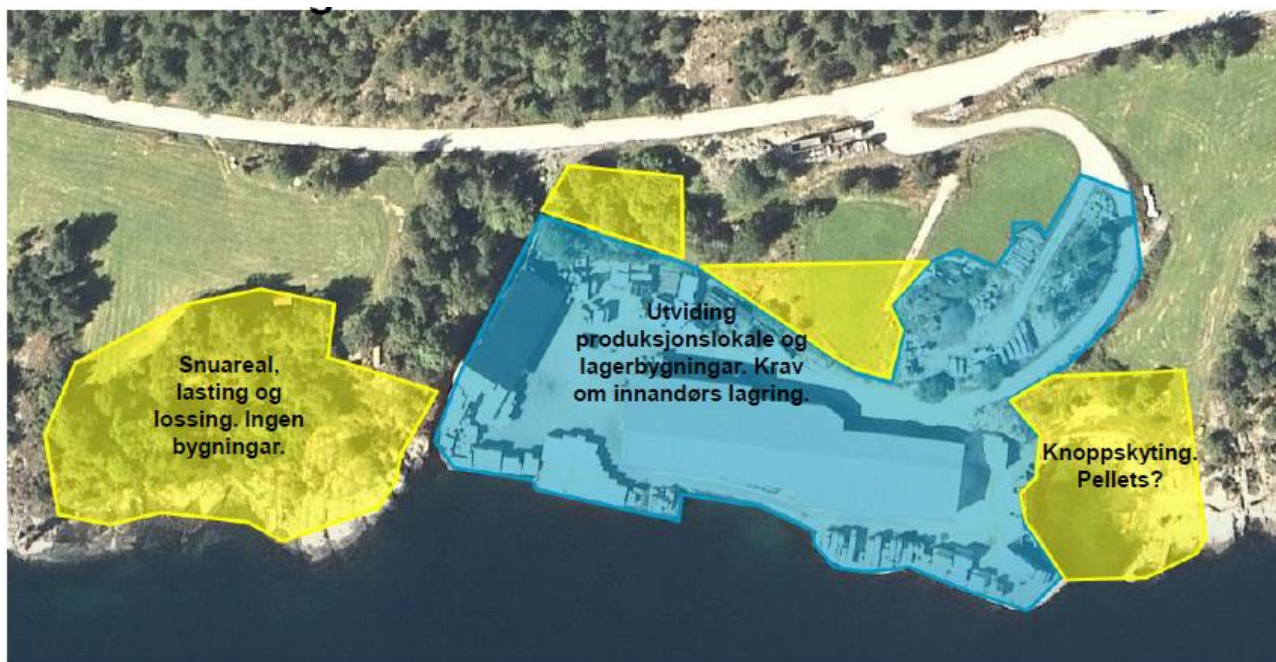
Figur 2 Dagens produksjonsareal markert med blå skravur. Naudsynt areal for utviding markert med gul skravur.

Oppdragsgiver: Sæle Sag AS Oppdragsnr.: 5207551 Dokumentnr. 001