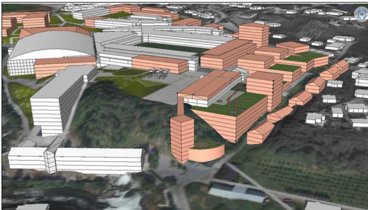
Figur 1 viser illustrasjon av moglege utvikling av Campus, lagt fram av Sogndal fotball i 2016

Eigarane av Fosshaugane Campus har også planar om at Campus skal vekse, sjå illustrasjonen nedanfor presentert at Sogndal fotball i 2016. Ei slik utvikling vil også krevje parkeringsplassar. Gitt at trafikken ikkje skal auke i Trolladalen må også desse parkeringsplassane etablerast ved Ingafossen.