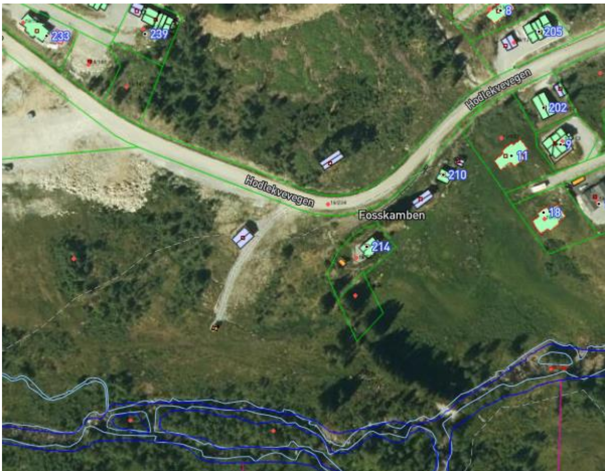
Figur 2 Skjermdump av eksisterende veg forbi brønnhuset i Hodlekve